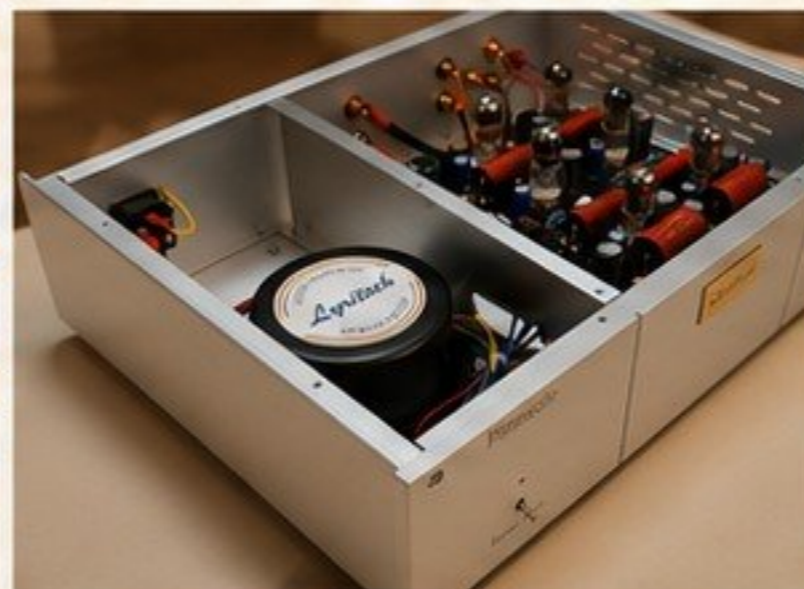
PINNACLE - PREVIO DE PHONO MM/MC