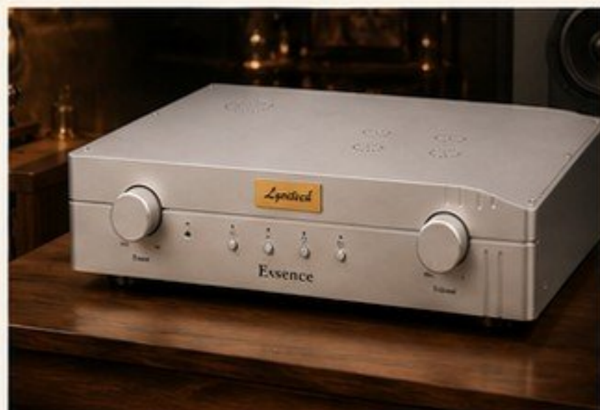
ESSENCE - PREVIO A VÁLVULAS