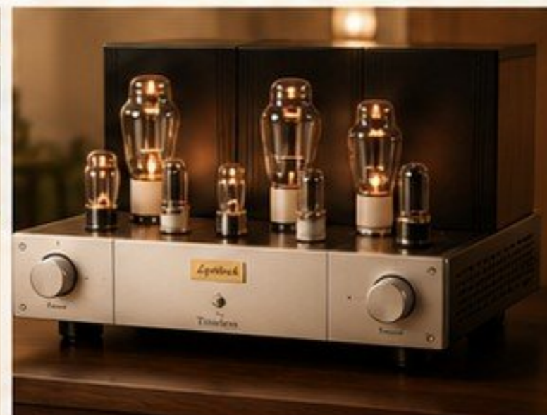
TIMELESS - ETAPA 300B