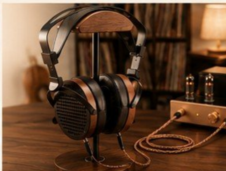
HARMONY - AURICULARES MAGNÉTICOS