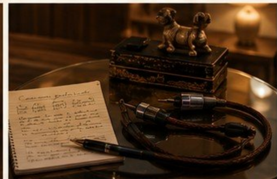
ACCESORIOS - DETALLES QUE IMPORTAN